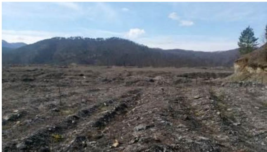
Slika 2: Trenutno stanje tijela deponije na lokaciji buduće regionalne sanitarne deponije

Do lokacije se može doći regionalnim putem R-469 Ribnica-Banovići-Živinice, koji je povezan sa lokalnim asfaltiranim putem dužine 1 km. Od lokalnog puta, neasfaltirani put vodi do ulaza na deponiju, dužine oko 1,2 km i širine 5-7 metara. Trenutno je u lošem stanju i morat će se rekonstruisati.