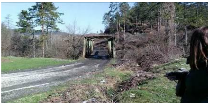
Slika 3: Most koji vodi ka lokaciji buduće regionalne sanitarne deponije preko Rijeke „Oskova“

Rijeka Oskova protiče na cca. 300 m zapadno od planirane lokacije tijela deponije. Planirano je da se rekonstruiše most preko rijeke Oskove (Slika 3) kako bi se omogućio pristup teških transportnih kamiona na lokaciju deponije.